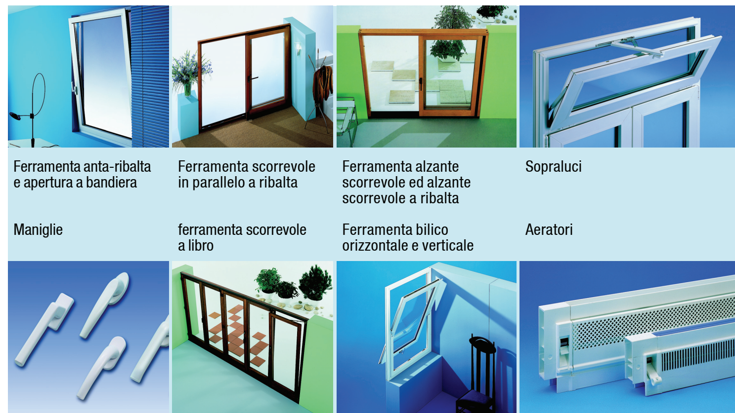
Ferramenta anta-ribalta e apertura a bandiera